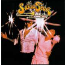
Edgardo Morales Timbales