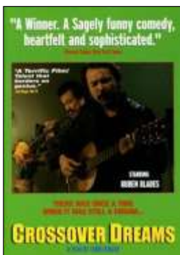
Título original: Crossover Dreams