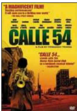
Título original: Calle 54 Año: 2000 Duración: 105 min. País: España España Dirección: Fernando Trueba Guion: Fernando Trueba Música: Varios Fotografía: José Luis López Linares