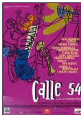
Reparto: Michel Camilo, Gato Barbieri, Tito Puente, Chucho Valdés, Bebo Valdés, Cachao, Eliane Elías, Paquito D' Rivera, Chano Domínguez, Jerry González Género: Documental: Documental sobre música. Jazz